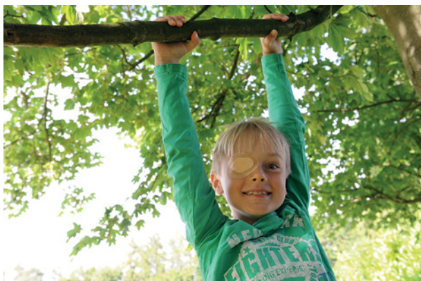
Abb. 5: Abklebebehandlung

Führen Brille und Abdeckung nicht zu einer Besserung der Sehschärfe, weil die Amblyopiebehandlung nicht rechtzeitig beginnen konnte, kann bisweilen eine Schulungsbehandlung durch den Augenarzt oder die Orthoptistin weiterhelfen. Neuere Therapiemethoden arbeiten hier auch mit computergestützter Amblyopie-Schulung. Das Kind wird in der Sehschule (Orthoptik) in die Übungen eingewiesen, die es dann täglich zu Hause fortsetzen soll.